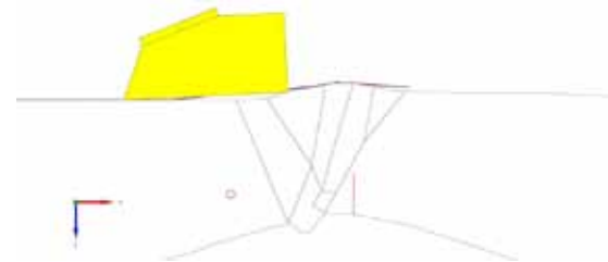
Inserção dos defeitos na soldadura.