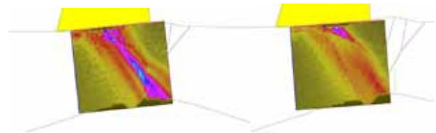
Cálculo do campo ultra-sônicos de acordo com duas posições mecânicas.