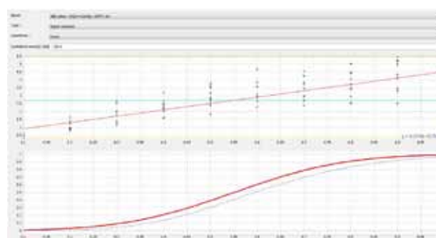
Curva POD obtida em função da altura do defeito com uma forte variação de lift-off.