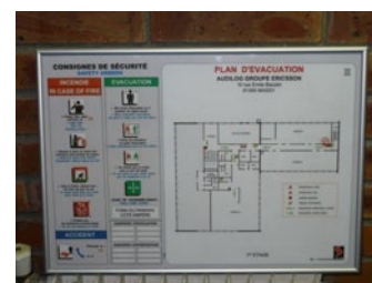
Plan d'évacuation d'EXTENDE